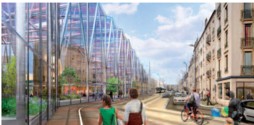
Perspective du projet Artem Nancy depuis la rue du Sergent Blandan © ANMA / Agence Nicolas Michelin et associés, 2007