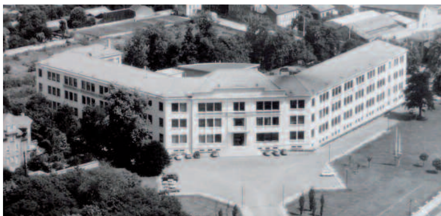
Vue aérienne de l'École des Mines de Nancy, parc de Saurupt, vers 1960