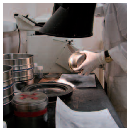
Manipulation en métallurgie des poudres