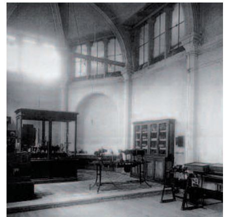
Une chapelle désaffectée voisine du bâtiment de la place Carnot fut le premier amphithéâtre de l'École

promotions à une vingtaine d'élèves en 1938 afin de maintenir le niveau de l'École : cette baisse est due à la fois à la diminution du recrutement régional, très important les premières années, à la crise économique et à la faiblesse de la natalité pendant la période de la guerre de 1914-1918. Tous les diplômés se placent sans difficulté jusqu'en 1930 mais les années de crise amènent plusieurs anciens élèves sur le marché du travail. En 1938, l'École peut enfin délivrer le diplôme d'Ingénieur Civil des Mines, commun avec celui des Écoles des Mines de Paris et de Saint-Étienne et les difficultés de placement disparaissent.