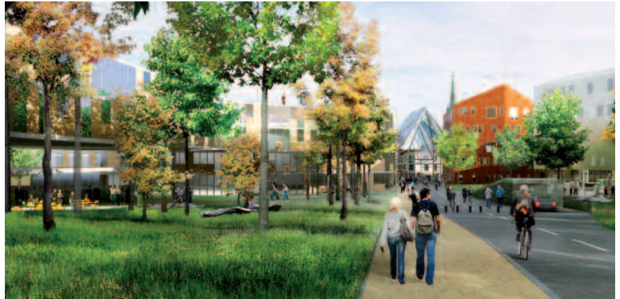
Vue d'une des cours intérieures © ANMA / Agence Nicolas Michelin et associés, 2007

Lieu de vie pour les étudiants et les habitants, la galerie accueillera les portes d'entrée autonomes des différentes écoles qui communiqueront entre elles en partageant des jardins communs. La galerie à l'architecture aérienne de style un peu baroque avec des poteaux palmés est ainsi un lieu d'activité intense ; traitée avec une verrière colorée, elle dégage une atmosphère dynamique et multiple.