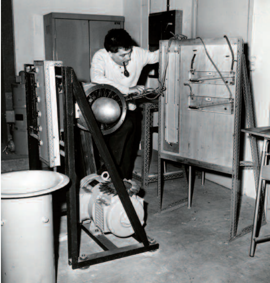
Activité de recherche en mécanique des fluides

■ 1980 > Le même document de présentation consacre plus d'un quart de ses pages au rôle de la recherche dans l'École en le déclinant sur plusieurs registres. Sont présentés entre autres : les concepts de formation par la recherche et de recherche orientée ainsi que les liens entre les axes d'approfondissement du cursus des élèves et les axes de recherche dans les six laboratoires alors hébergés par l'École dans les grands domaines de recherche suivants : Matériaux, Informatique, Énergétique et Mécanique, Mécanique des Terrains. Depuis cette période faste pour l'économie, la taille des laboratoires de l'École s'est accrue continûment et de nouveaux « concepts » ont vu le jour : les Centres de Recherche puis, plus récemment, les Instituts de Recherche.