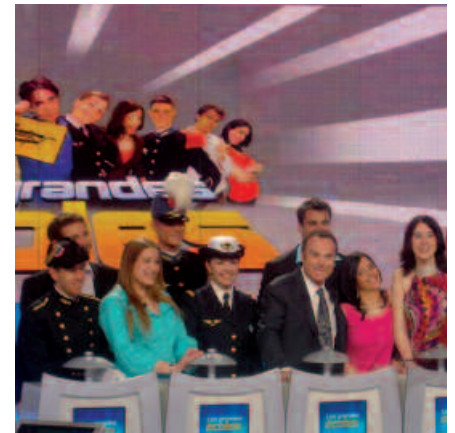
Participation de l'École à l'émission « Questions pour un Champion spéciale Grandes Écoles »

La mise en place de deux formations d'ingénieurs de spécialité (Matériaux et Gestion de Production en 1991 et Ingénierie de la Conception en 2001) permet à l'École de développer son offre de formation et d'être ainsi acteur de l'emploi en Lorraine. Artem Nancy contribue à l'image d'ouverture et de dynamisme de Nancy et sera le cœur d'un des plus grands chantiers universitaires de France : construits sur le site des anciennes casernes Molitor-Manutention. La Communauté urbaine du Grand Nancy assure la maîtrise d'ouvrage de ce projet cofinancé par l'État et les collectivités territoriales.