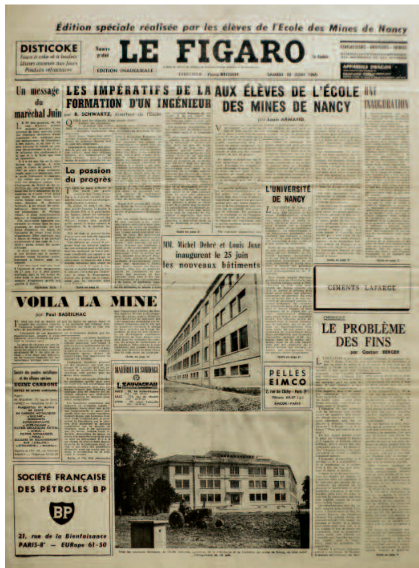
Édition spéciale du Figaro parue le 25 juin 1960 et réalisée par les élèves de l'École des Mines de Nancy